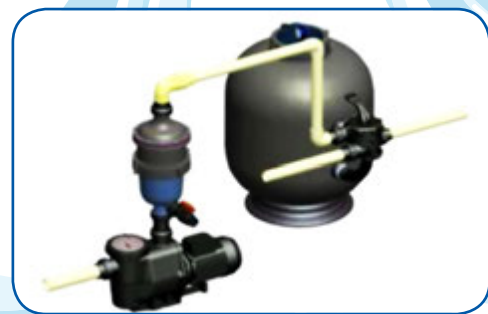
Instalación típica con un filtro de arena.