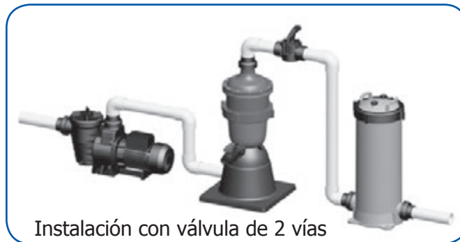
Instalación con válvula de 2 vías

Cuando la bomba no este operando cierre la válvula de 2 vías y abra la válvula de purga. Encienda la bomba para purgar la cámara de sedimentación de su sedimento. Una vez que la cámara de sedimentación es purgada, desconecte la bomba y abra la válvula de 2 vías y cierre la válvula de purga.