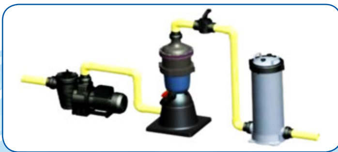
Instalación típica con un filtro del cartucho

Si el flujo de agua entrante es menor que los requisitos mínimos de flujo del filtro, la eficiencia de filtración del filtro será afectada, por favor consulte a InterWater.