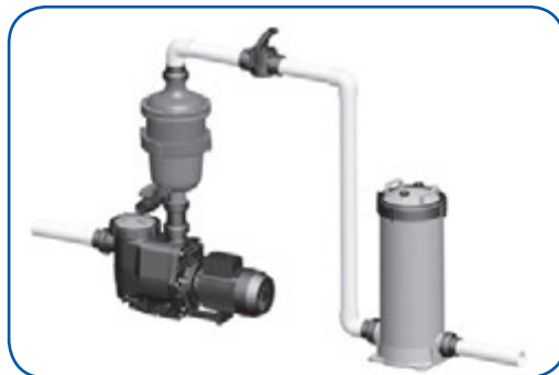
La instalación con Pedestal opcional de Montaje

Un Pedestal opcional para montar la unidad también está disponible para situaciones donde el MultiCyclone no puede ser instalado directamente por encima de su bomba de la alberca.